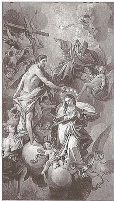
M. Foschini, la Trinità con l'Immacolata, Cattedrale, Cerreto Sannita.

desimo soggetto tanto ammirata dal vescovo Albini durante la visita pastorale del 1706. Il dipinto giunto sino a noi in pessimo stato di conservazione e peraltro abbondantemente restaurato, è di grande impatto scenografico. In primo piano il maligno, impersonato da un nudo con un forcione in mano, volge allo spettatore le spalle anatomicamente perfette, in un accentuato scorcio prospettico. Sull'asse diagonale del quadro appaiono la Vergine del Soccorso col Bambino e con la fiaccola ardente, simbolo dell'amore divino, San Giovannino orante, S. Rocco e S. Sebastiano. La luminosità coloristica della Vergine fa da contrappunto al dorso in controluce del demone. Anche qui il Foschini, evidenza, come altrove, una stretta adesione ai modi del Solimena suo maestro, tuttavia tiene conto dell'insegnamento di altri suoi contemporanei e si apre ad un linguaggio più classicista. Dal vescovo di Cerreto Sannita nel 1748 gli venne commissionata una tela di vaste dimensioni e ciò testimonia la notorietà e il prestigio di cui il pittore godeva. La tela, rappresentante La Trinità con l'Immacolata, campeggia sull'altare maggiore ed è di grande effetto scenografico. L'ardita composizione, il perfetto modellato e il colore squillante ne fanno un vero capolavoro. Oltre che in Guardia S., Cerreto S., Frasso