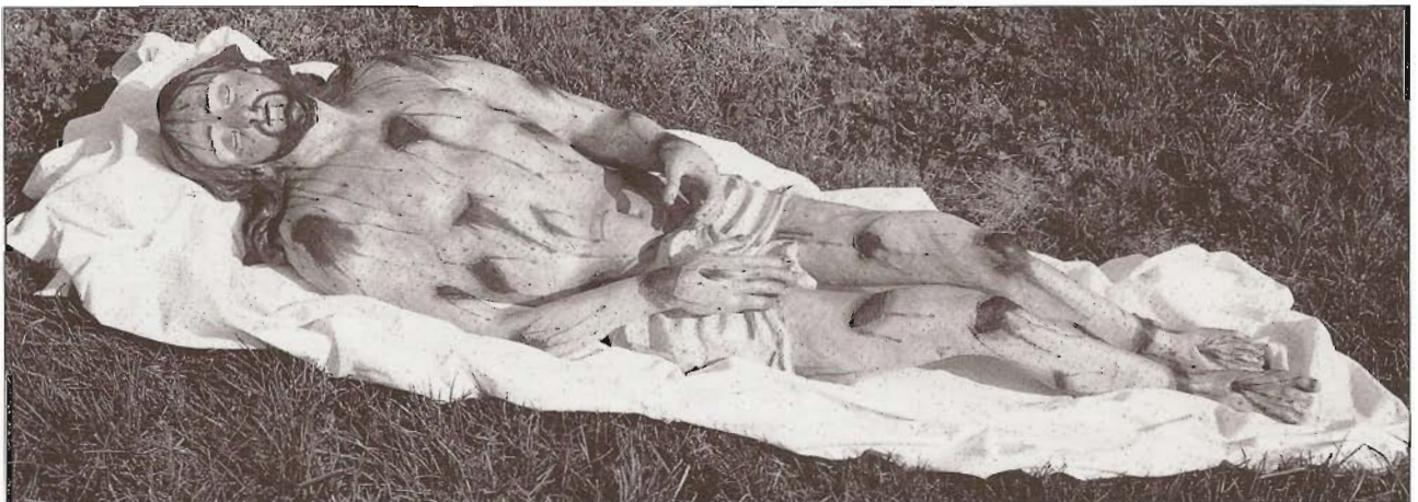
Il "Cristo deposto" della Chiesa di Campanile, dopo il restauro.

La scultura, ha subito, in passato, un intervento di restauro fuorviante per una corretta lettura dell'opera: una verniciatura, con gommalacca , del tipo adoperato dai falegnami per i mobili. Il corpo del Cristo, dalle sembianze mimetiche, reso da un ottimo modellato in carta e da un'accurata colorazione, è stato contraffatto dalla verniciatura che le ha fatto assumere un aspetto mono-